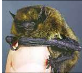
Zwergfledermaus